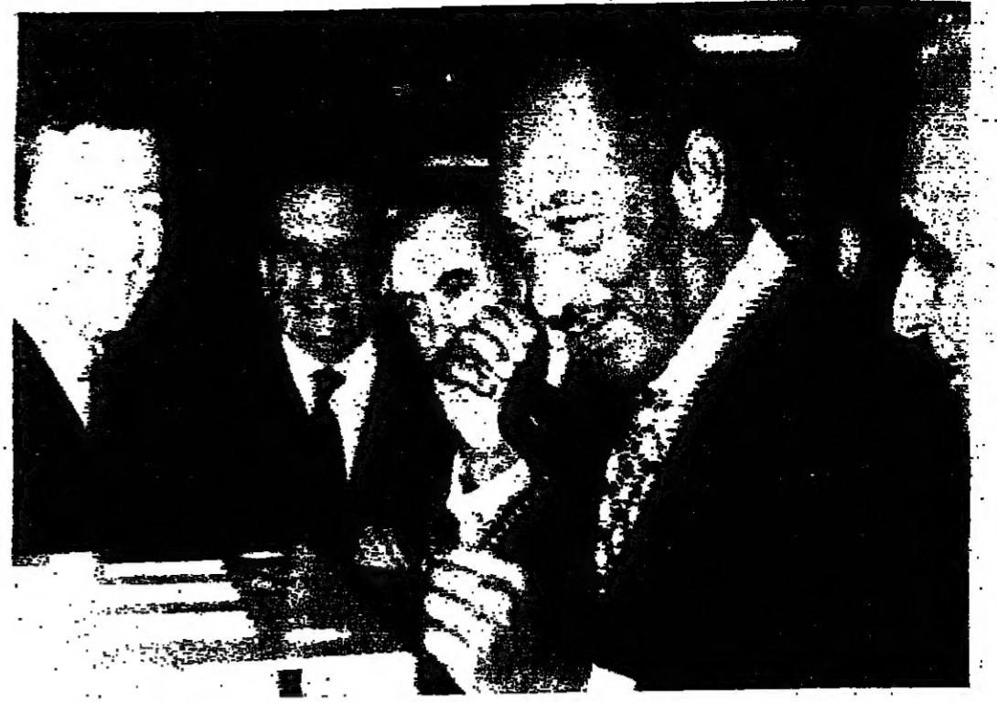
الرئيس السادات يجري اتصالاً بالراديو خاصة «بالتوار» (من أ ب) (صورة بالراديو خاصة «بالتوار» من أ ب)